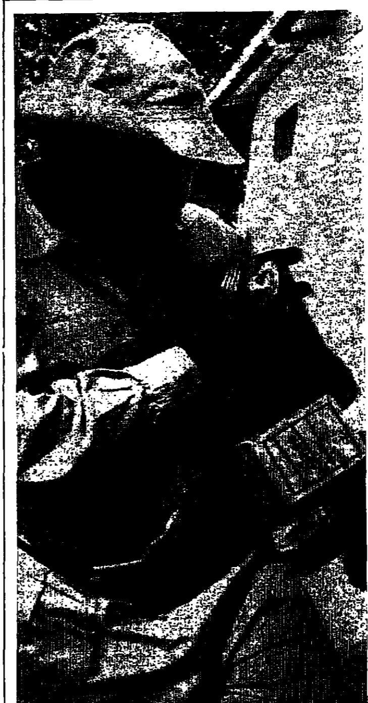
السيد رشيد كرواوا نائب رئيس جمهورية تانزانيا يحمل اوائته بعد انضمامه الى معسكر التدريب ( روفو ) قرب دار السلام بجمهورية تنزانيا

في تصريحات ايمان بشأن قناة السويس - التي ادلى بها الى رايدو اسرائيل وعمتها وكالات الأنباء - نسي وزير خارجية اسرائيل نقطتين مهمتين: اولهما - ان اسرائيل - تلك على الضفة الشرقية للقناة اكثر من صفة « الاخوان المؤتمت » - وهذا لا يمنحها اي حق من حقوق التصرف . يتعلق بالقناة . والثاني - ان الجبهة العربية المتحدة لا تزال في حالة حرب مع اسرائيل . هذا يمنحها حق اغلاق قناة السويس في وجه الملاحة . اسرائيلية . بموجب اتفاقية التصطنبية المعروفة . وايمان ليس غفلاً في السياسة . لذلك نفترض انه يعرف الحقيقتين . ولكنه حين يتحدث الى الخارج يفترض ان الرأي العام العالمي لا يعرف كل الحقائق . بالاضافة الى ان الرأي العام مهيأ لقبول اي كذبة تصدر عن اي مسؤول اسرائيلي . لذلك لا يفرض ايمان ان يضيف الى استنتاجات السابفة كذبة جديدة . ولئن السؤالي هو : لماذا تترك أجهزة الاعلام العربية الرأي العام العالمي تحت سيطرة أجهزة الاعلام الاسرائيلية . ولماذا لا تقوم بدور فعال في احيال الحقائق الى الشعوب والنسولين في الالم الخارجي ؟ ان عجزنا في الخارج - كما ثبت قبل وبعد نسخة حزيران - عن مزاولة مع الاعلام الاسرائيلي . وجبهة الرأي العام العالي لا تل أهمية ابدان عن جبهة المواجهة مع اسرائيل . ومن رأينا ان على الدول العربية ان تعيد النظر في اجيزتها الاعلامية . بما في ذلك اجيزتها الدبلوماسية . لتكون في مستوى معركتنا مع اسرائيل في جبهة الرأي العام العالمي . ولا يكتفي الاثر ان نعقد المؤتمرات الصحفية في عمان او القاهرة او بيروت بل يجب ان نعقد المؤتمرات - ونظم الندوات - في كل عاصمة من عواصم العالم . حيث يجب ان يكون هناك اعلام عربي - من وقادر ونشط . ومستعد لفضح الحقائق كلما صدر عن تل ابيب تصريح - من مثل تصريح ايمان الضلل الاثر .